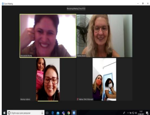
Imagem 12 – Cooperação técnica