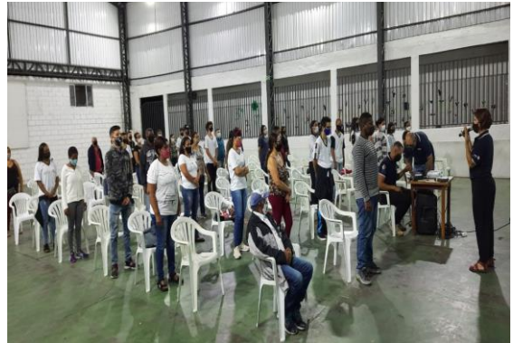
Imagem 10 – Encontro Familiar