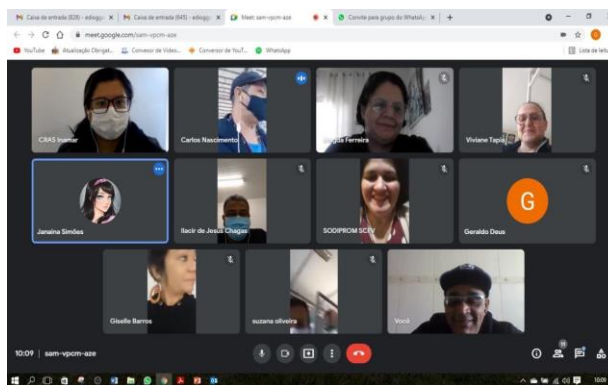
Imagem 13 – Reunião do Grupo Gestor CEU DAS Artes