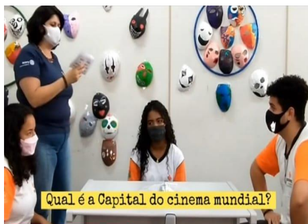
Imagem 1 e 2 - Gravação do Projeto Férias com adolescentes representando das regiões Centro, Inamar e Eldorado (cenas dos vídeos publicados nas redes sociais).