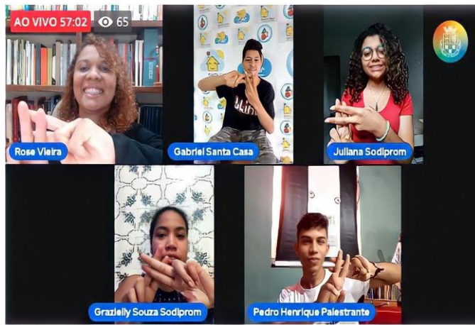
Imagem 11 e 12 – Participação dos adolescentes da Sodiprom na Live Compet – O Protagonismo Juvenil e a Rede de Proteção.