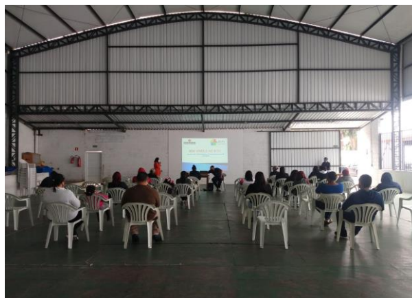
Imagem 06 – Encontro Familiar