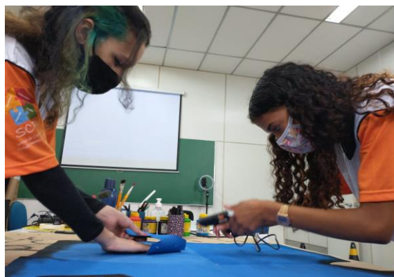
Imagem 07 e 08 – Atividades de retorno presencial na Região Centro com roda de conversa e atividades de criação e arte.