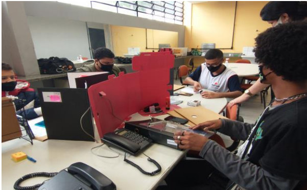
Imagem 09 – Encontro do Saber Técnicas Administrativas.